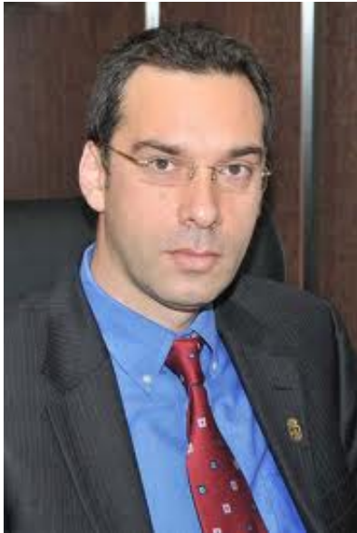
ДО Г-Н КОСТАНТИН ЛУКОВ ПРЕДСЕДАТЕЛ НА ОБЩИНСКИ СЪВЕТ - БУРГАС