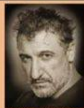
Кирил Ефремов - Лауреат на Международния фестивал във Варшава, както и заслужил деятел на сцената на изкуство, артист по чл. 9, от. услуги

Ще можете да видите следните театрални миниатюри: