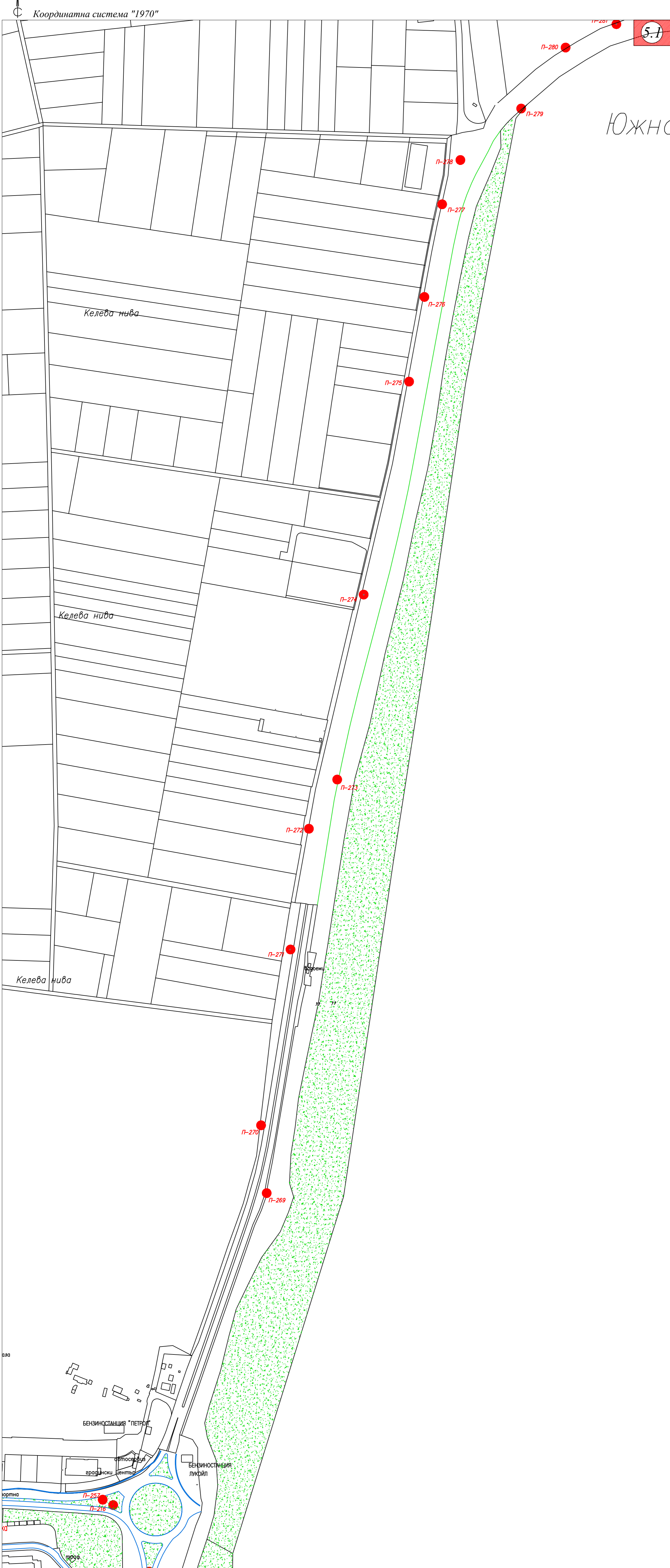
Схема на разполагане на информационните елементи - РИЕ /по път Бургас- Сарафово - Е87/