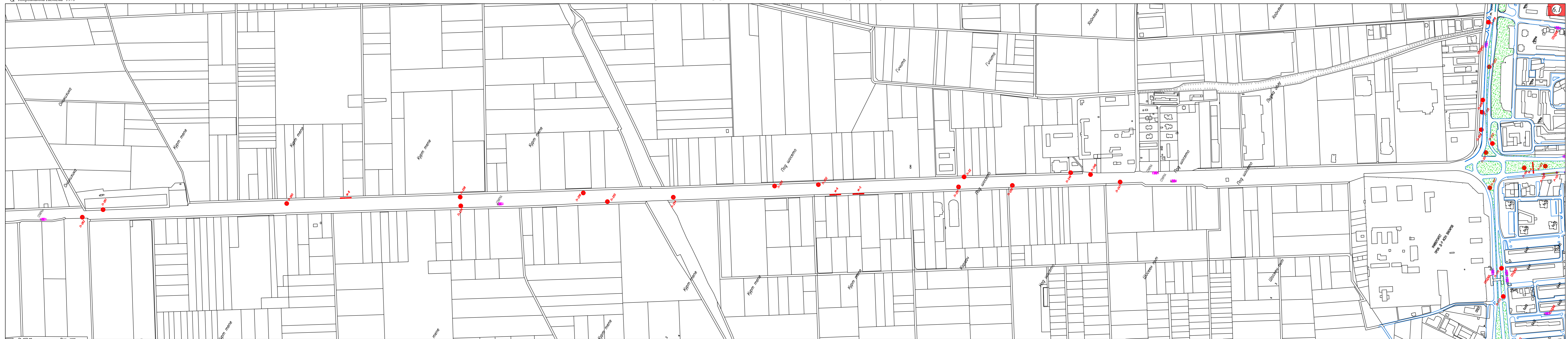
Схема на разположение на информационните елементи - РИЕ /по път Бургас- Ветрен - Е 773/